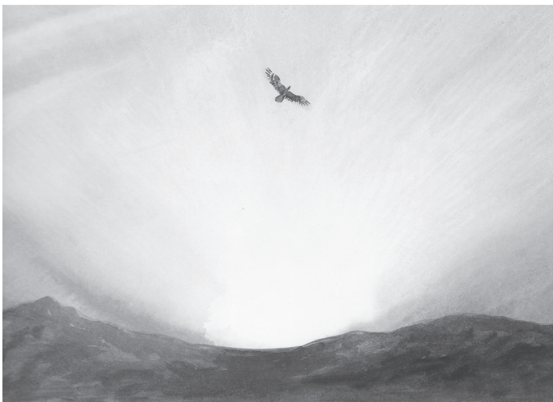
Vole, l'aigle, vole de Christopher Gregorowski, illustrations de Niki Daly. Publié par Simon and Schuster, New York. Droits d'auteur sur le texte © 2000 de Christopher Gregorowski et droits d'auteur sur les illustrations © 2000 de Niki Daly. Une demande a été introduite pour les droits d'auteur.

Alors, sans véritablement bouger, sentant le souffle ascendant d'un vent plus puissant qu'un homme ou qu'un oiseau, le grand aigle se pencha en avant et se laissa emporter dans le ciel, de plus en plus haut. Il disparut dans la clarté du soleil levant pour ne plus jamais vivre parmi les poulets.