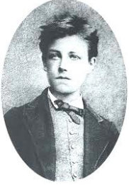
➡ Arthur Rimbaud (1854-1891)

Précise pour chacun de ces auteurs s'il est plutôt un : romancier - poète - dramaturge - conteur.