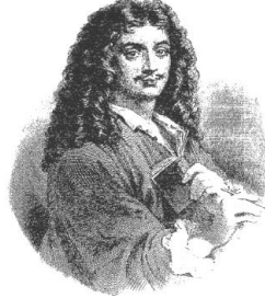
➡ Molière (1622-1673)