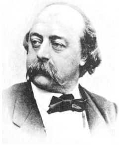
➡ Gustave Flaubert (1821-1880)