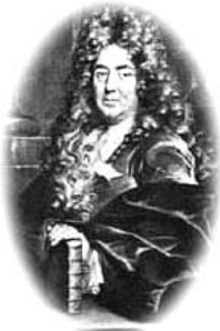
➡ Charles Perrault (1628-1703)